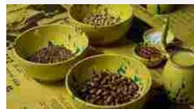
Legumi, vino, ceramiche Arriva Leguminaria