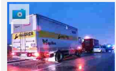
Scontro da paura sulla variante, cinque veicoli coinvolti