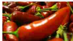
Il peperoncino, ecco il re della festa a Castel di Lama